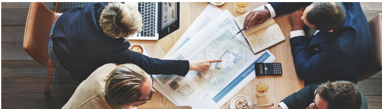
Handel informacjami poufnymi